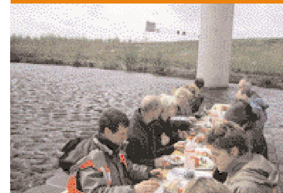
Lunch op het water, een meertje onder de viaducten van knooppunt Ridderkerk.

Wegen naar de Toekomst (WnT) is een innovatieproject van Rijkswaterstaat. De missie van WnT luidt: lever visionaire, praktische en toekomstgerichte innovatieve bijdragen aan hoogwaardige (schone, slimme, aangename en veilige) mobiliteit voor alle daarbij betrokken burgers van Nederland. Kenmerkend voor het programma is het ontwikkelen van lange termijn visies in combinatie met het op korte termijn uitvoeren van concrete proefprojecten. Daarbij wordt nadrukkelijk het publiek – zowel leken als deskundigen – betrokken. Het programma is gestart in 1996 en heeft net zijn tweede cyclus afgesloten. In die cyclus stonden vier thema's centraal: Virtuele Mobiliteit, Wegdek van de Toekomst, Flexibele Infrastructuur en Wegarchitectuur 2030 (voor de laatste nam de Bouwdienst het themaleiderschap voor zijn rekening). Wegarchitectuur 2030 bestond uit twee proefprojecten: Snelweghuis en Geluid. Het eerste verkende de mogelijkheden om woningen te bouwen in de directe omgeving van de snelweg, het tweede richtte zich op maatregelen die het verkeerslawaai kunnen verminderen. Het project De Fenomenale Weg is ook uitgevoerd in het kader van het thema Wegarchitectuur 2030. Inmiddels is de derde cyclus van WnT van start gegaan met vijf nieuwe thema's.